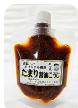
たまり醤油こうじ